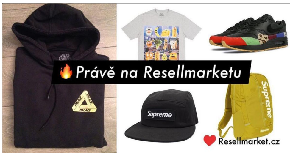
Příklad Open Graph obrázku

Služba umožňuje také úpravu a generování obrázků, na které internetové obchody odkazují v hlavičkách produktových stránek. Když běžný uživatel sdílí produkt na sociálních sítích, zobrazí se v příspěvku upravená produktová fotografie.